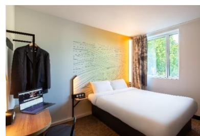
St Denis Porte de Paris (France)

La crise sanitaire et ses répercussions sur le secteur du tourisme et de l'hôtellerie n'ont pas eu raison de la volonté du Groupe B&B HOTELS de poursuivre son développement.