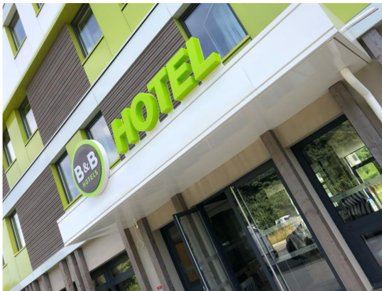
Hôtel B&B Paris Meudon Vélizy