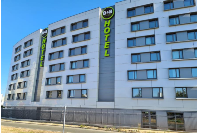
B&B Hôtel Saint-Denis Porte de Paris